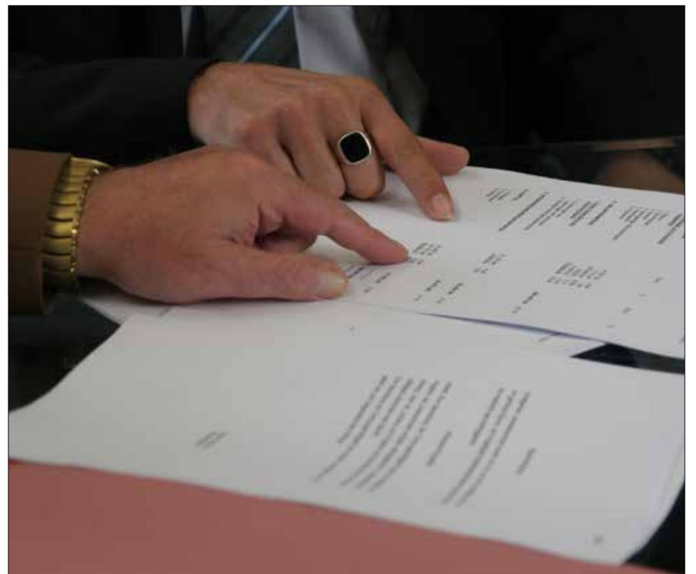
The program will also assist clients with cases of tenant harassment.

"We've seen time and again that dishonest landlords will use illegal harassment as a way to displace working families from affordable housing just to make a quick profit," said Congresswoman Nydia M. Velázquez. "One of our best defenses against these unscrupulous techniques is ensuring tenants know their rights under the law and have access to quality legal services."