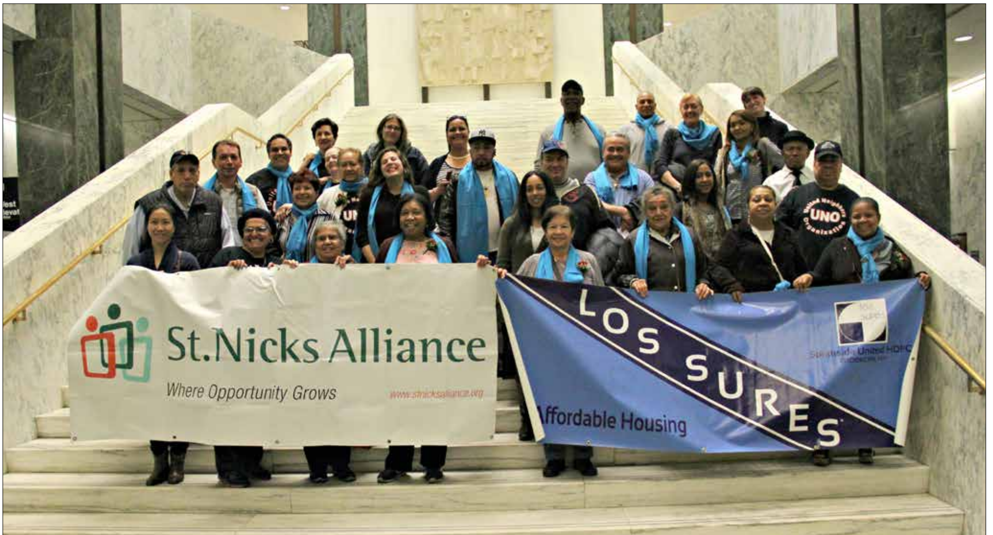
Southside United HDFC y St. Nicks Alliance fueron a Albany para hablar con funcionarios elegidos acerca del Programa de Preservación de Vecindarios.

El mes pasado, residentes del norte de Brooklyn fueron al capitolio del estado de Nueva York para hablar con funcionarios elegidos acerca del Programa de Preservación de Vecindarios.