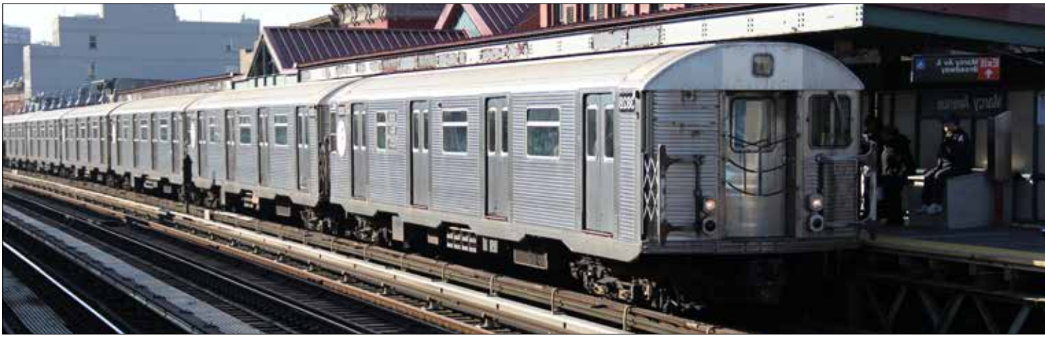
The proposal is accompanied by a $26 billion investment that will renovate 30 stations.