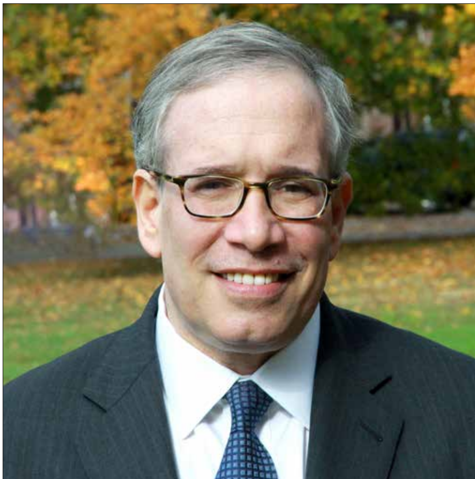
Comptroller Scott M. Stringer.