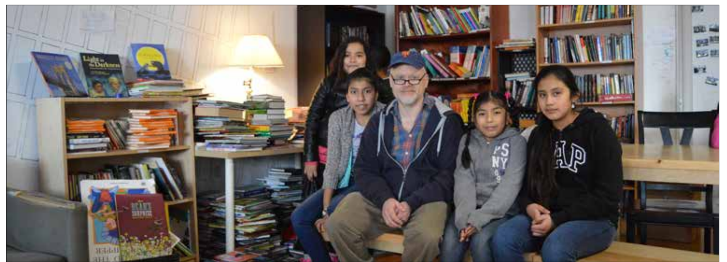
Dirigido por Stephen Haff, Still Waters in a Storm es un programa de lectura y escritura en Bushwick.

leyendo y escribiendo y están mejorando. Esto se manifiesta en sus boletines de calificaciones y están mejorando en la lectura y la escritura. Además, ellos saben que este es un lugar tranquilo y seguro”, continuó Haff.