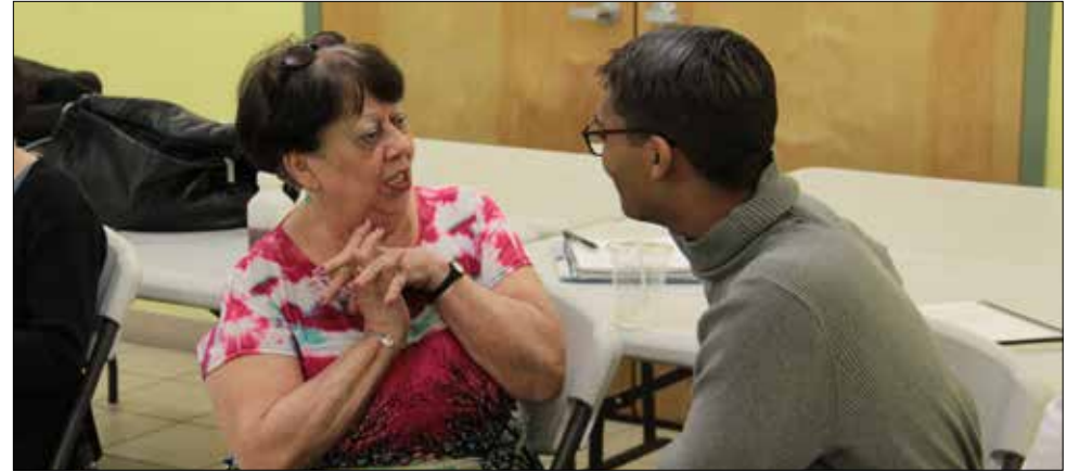
Estudiantes de la Escuela Gallatin de la Universidad de Nueva York serán emparejados con miembros de la comunidad para registrar su historia oral.

Los estudiantes de la Escuela Gallatin de la Universidad de Nueva York van a pasar un buen tiempo en Los Sures esta primavera como parte de un curso de la universidad que grabara la historia oral de los residentes locales.