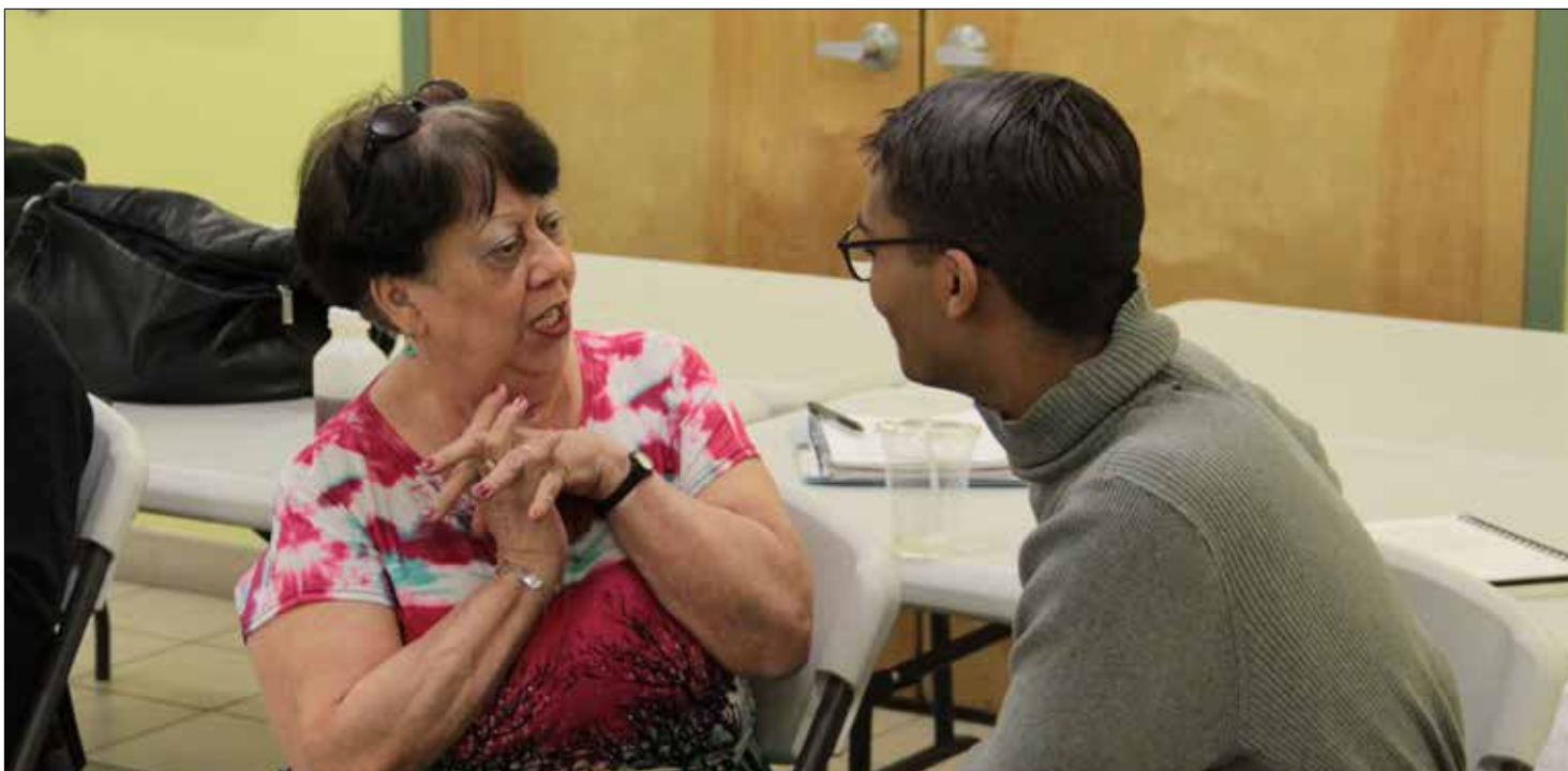
NYU students have been paired up with a member of the community to record their oral history.

Students from the Gallatin School of Individualized Study at New York University will be spending some time in Los Sures this spring as part of a college course to record the oral history of local residents.