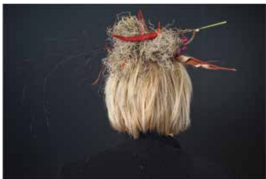
Vieno Motors: How to Prepare 1.0. Project by Ilona Valkonen.

Exhibition curated by Satu Oksanen (Assistant Curator, HAM Helsinki Art Museum) Commissioned by International Studio & Curatorial Program (ISCP) in collaboration with El Museo de Los Sures