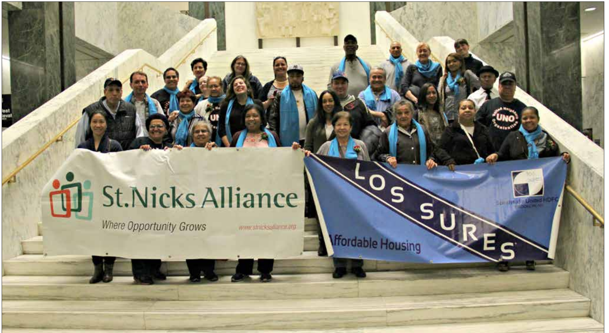
Southside United HDFC and St. Nicks Alliance went to Albany to talk to their elected officials about the Neighborhood Preservation Program.

Last month, residents of North Brooklyn went to the New York State Capitol to talk to their elected officials about the Neighborhood Preservation Program.