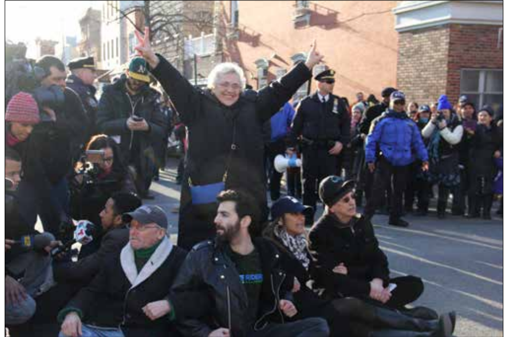
Left: Over 500 teachers, parents, children, elected officials and concerned community residents marching in solidarity with childcare centers in Williamsburg. Right: Elected officials and community leaders peacefully protesting at the corner of Manhattan Avenue and Ainsley Street.

Izquierda: Mas de 500 maestros, padres, niños, oficiales elegidos y residentes comunitarios marchando en solidaridad con guarderías de Williamsburg. Derecha: Oficiales elegidos y líderes de la comunidad protestando pacíficamente en la esquina de la Avenida Manhattan y la Calle Ainsley.