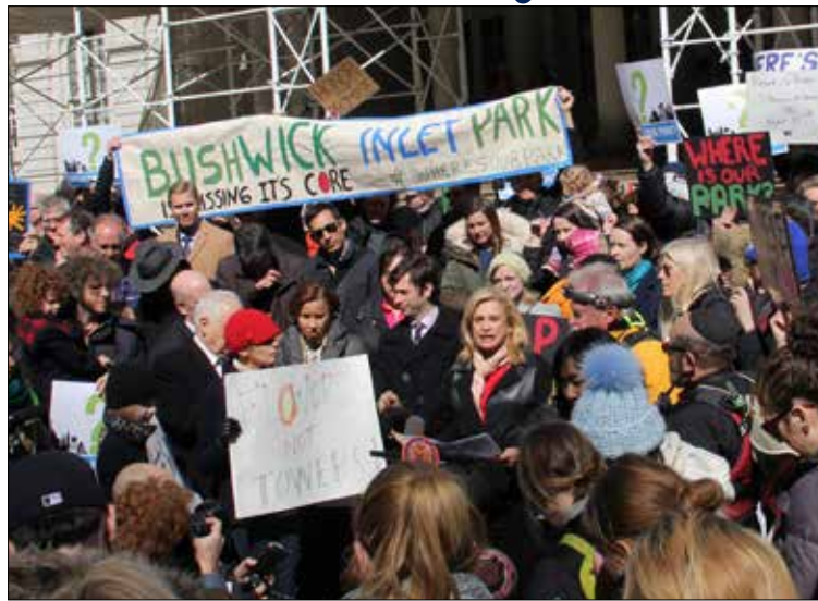
Congresswoman Maloney addresses residents at Inlet Park press conference La Congresista Maloeny hablando con residentes durante la rueda de prensa sobre el parke.

The rally brought attention to the lack of fulfillment on the city's promise made in the 2005 Waterfront Rezoning Agreement, in which the City of New York agreed to create a 28-acre Bushwick Inlet park. The rally was attended by residents and leaders of the community who supported the park, including Representative Carolyn Maloney, Representative Nydia Velázquez, Council Member Antonio Reynoso, among other elected officials and community organizations.