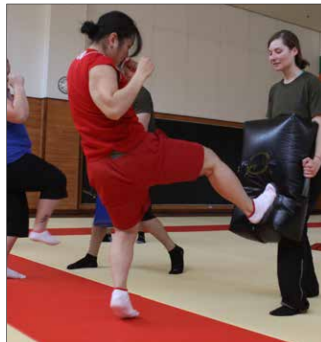
Women training at a self-defense class. Mujeres entrenando en una clase de defensa personal.

The class is free, open to the public, trans-inclusive, and taught by women. The next session is Sunday May 3 rd from 3-6pm at Traditional Okinawan Karate of Brooklyn, 248 McKibbin St Brooklyn, NY 11206. Individuals interested can register by calling 718-418-9892, or sending an email to selfdefense.brooklyn@gmail.com .